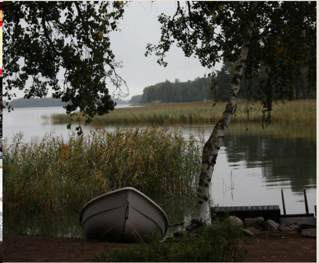
Fjord in Poikko, Naantali