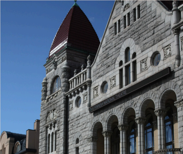
National finnish theatre Helsinki