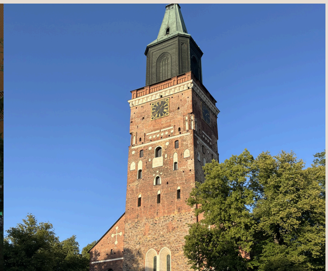
Dom von Turku