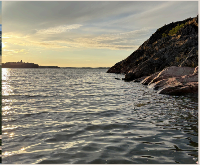
Sonnenuntergang in Ruissalo