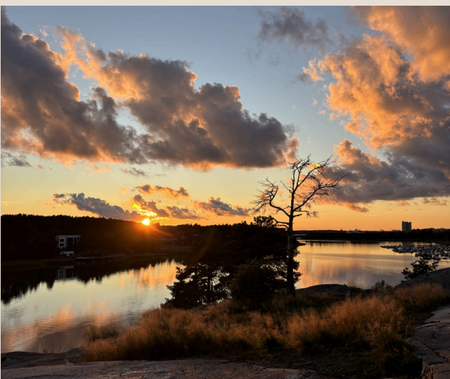
Sonnenuntergang an der Ispoinen Sauna Turku