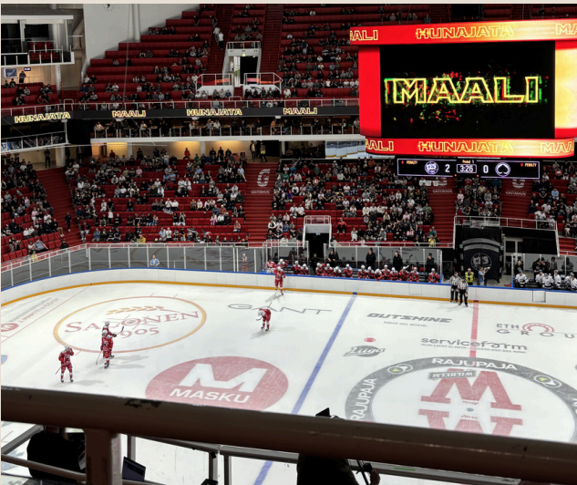
Eishockey in der Gatorade-Arena, Turku.