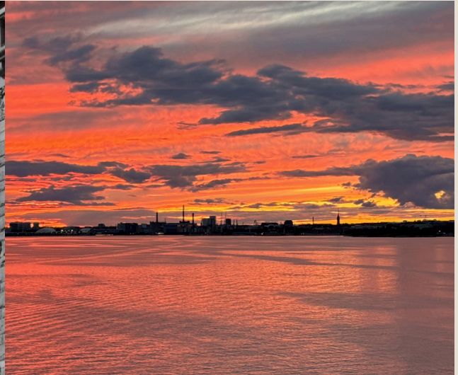
Sonnenuntergang Fähre Helsinki-Tallinn