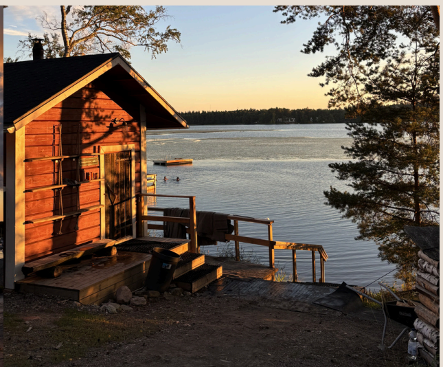
Sonnenuntergang an der Villa Järvelä, Turku-Littoinen