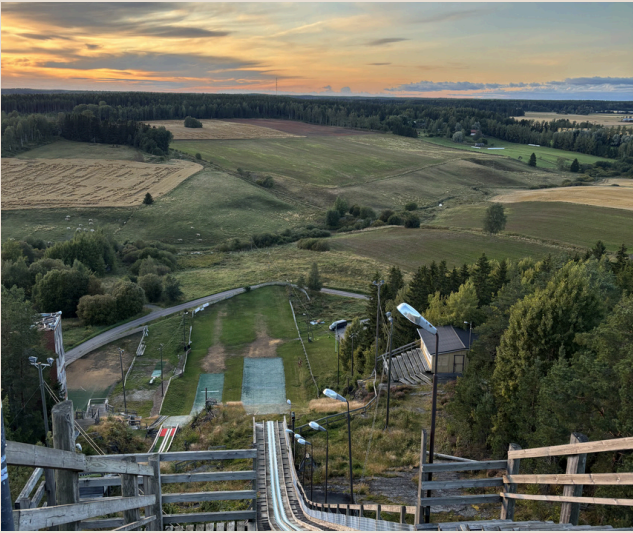
Sonnenuntergang auf der Skisprung- schanze in Paimio