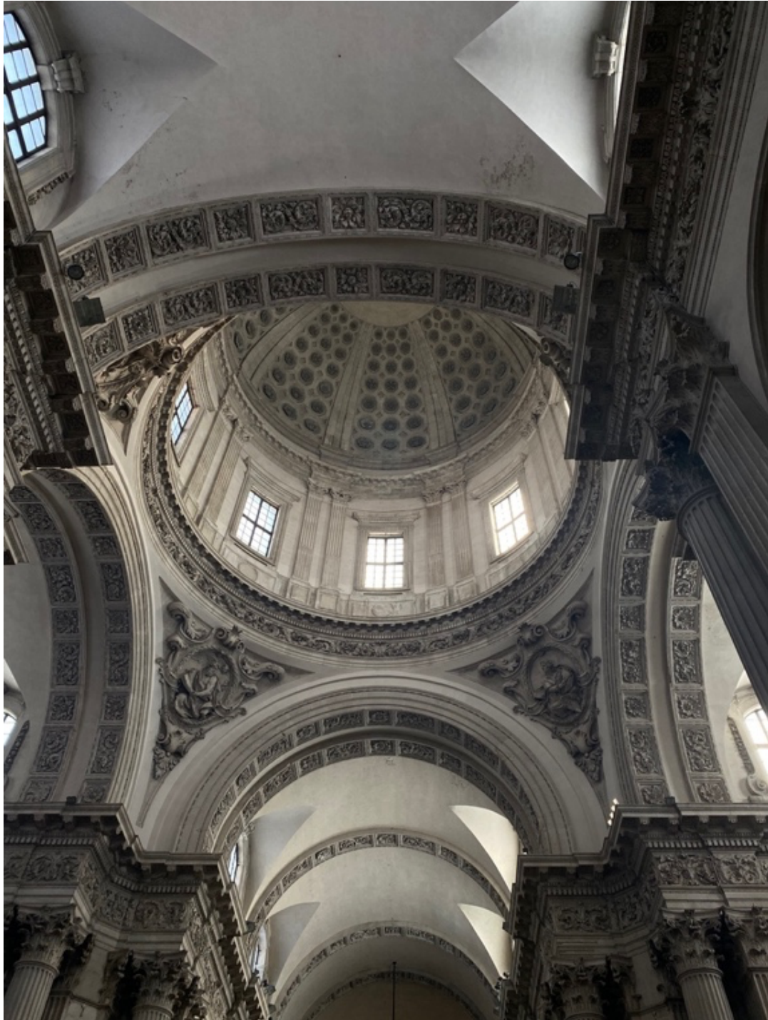
Santa Maria Assunta in Brescia